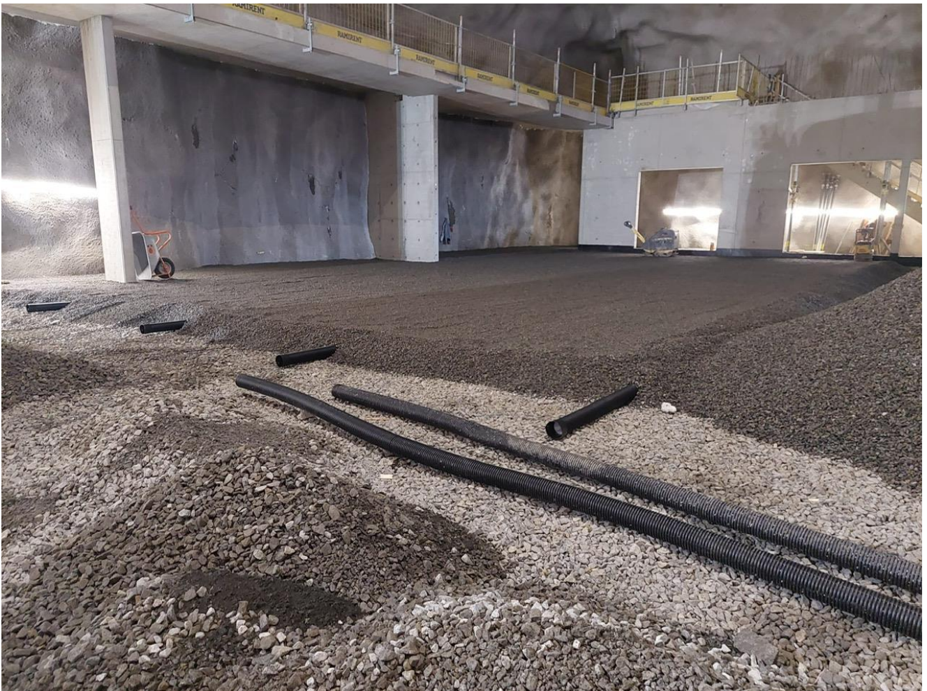
H1 maantasaustyöt käynnissä.