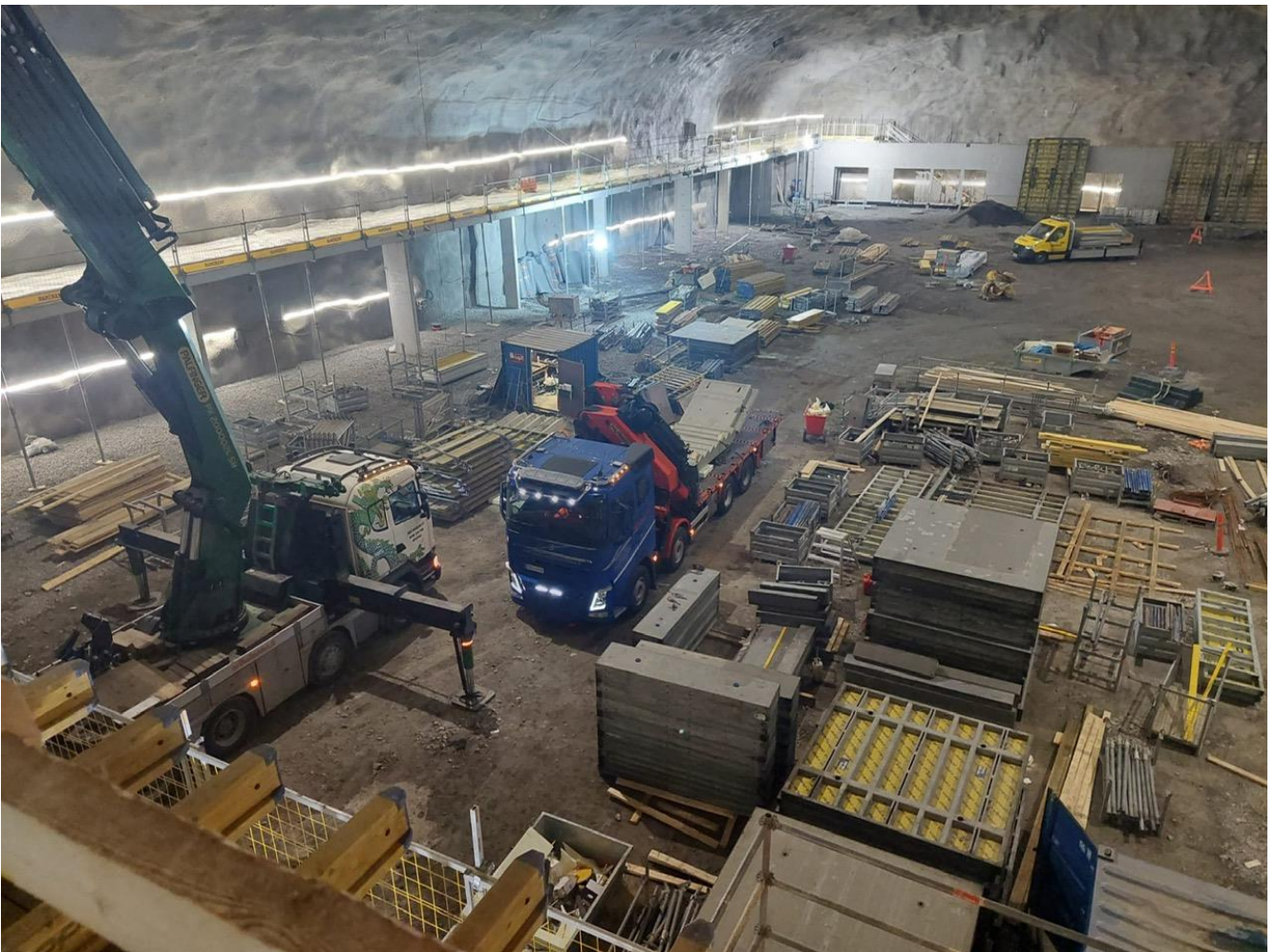
H1 alue kuvattuna R2 holvilta.